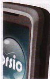
IrDA-порт есть, но его окошко найти непросто

Из предустановленных приложений отметим исключительно популярную у русскоязычных